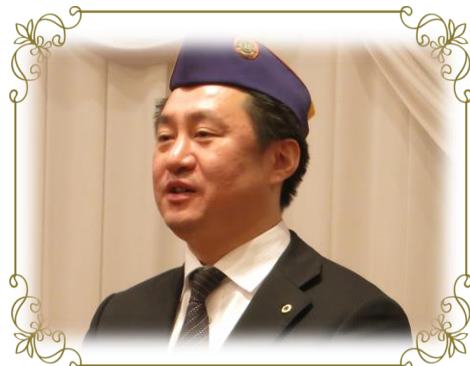
㈱LUZ ホテルニューカーリーナ 副総支配人