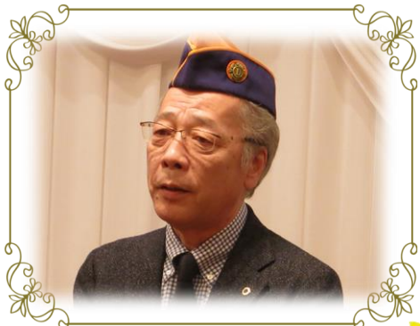
第30回盛岡 ㈱タイキ 代表取締役