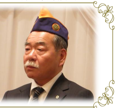
㈱ロックス 代表取締役